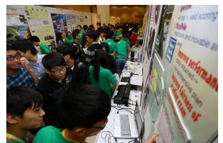
參考圖片：公開展覽